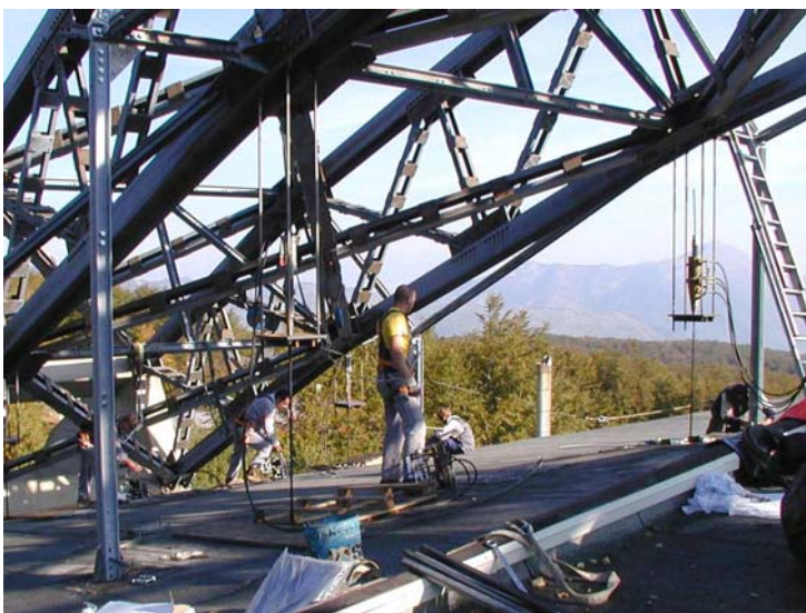
Durante le fasi di tiro dei trefoli con martinetti idraulici