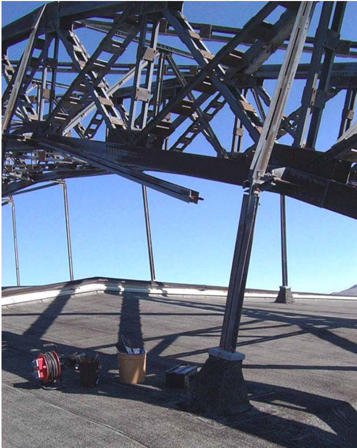
Particolare delle travi tranciate a causa dell'abbassamento (circa 25 cm.) della copertura sottostante la struttura reticolare ad arco di sostegno