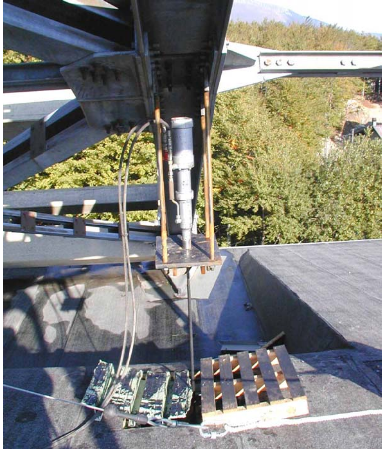
Particolare dei 4 martinetti utilizzati per il tiro ed il riassetto della copertura nella posizione originaria, mediante l'opportuno e preventivo posizionamento di piastre, barre e trefoli, agganciati alla struttura reticolare esterna ad arco ed alla sottostante travatura del tetto del Palazzetto